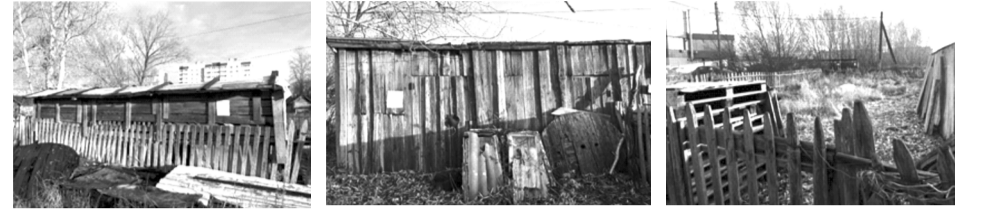
Хозяйственная постройка № 1 Хозяйственная постройка № 2 Деревянное ограждение (забор)

В противном случае после указанного срока Администрацией Великого Новгорода в судебном порядке будут приняты меры по признанию временных сооружений бесхозяйными и обращению их в муниципальную собственность с целью последующего сноса. Дополнительно Администрация Великого Новгорода сообщает, что за использование земельных участков без правоустанавливающих документов предусмотрена административная ответственность в виде штрафа: на граждан не менее 5 000 рублей, на юридических лиц не менее 100 000 рублей.