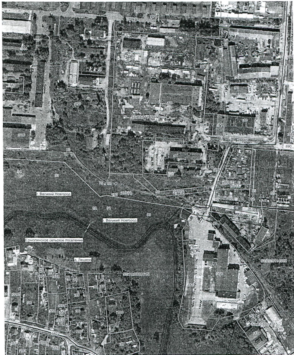
План границ объекта

Публичный сервитут объекта электросетевого хозяйства ВЛ-10 кВ Л-4 ПС Базовая (наименование объекта, местоположение границ которого описано (далее - объект)