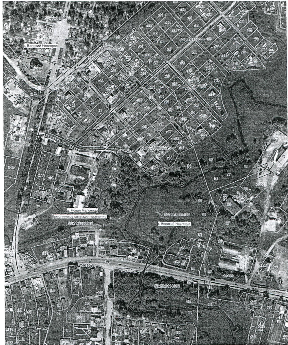
План границ объекта

Публичный сервитут объекта электросетевого хозяйства ВЛ-10 кВ Л-4 ПС Базовая (наименование объекта, местоположение границ которого описано в шабле - объекте)